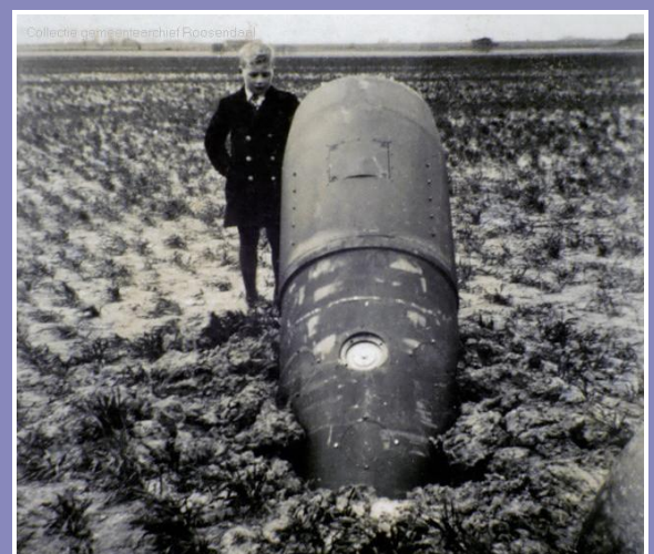
Een jongetje poseert bij een blindganger, 1945

Op 11 mei 1940 bevond Roosendaal zich midden in de oorlog. Duitse bommenwerpers bombardeerden en mitrailleurden ten zuiden van de stad een Franse colonne, die op weg was naar het noorden om het Nederlandse leger hulp te bieden in de strijd tegen de Duitsers. Om kwart over één 's middags vielen de eerste bommen op het spoorwegemplacement. Later op de middag werden de Vijfhuizenberg, de wei van Dekkers (nu de Nieuwe Markt), Nispen, de Kade, de Ludwigstraat en de Stationsstraat door bommen getroffen. In de Stationsstraat wierp een vliegtuig in duikvlucht vier bommen op een schuilloopgraaf. Zes inwoners vonden de dood, velen raakten gewond. Om ongeveer 20.00 uur voerden vliegtuigen van de Duitse Luftwaffe een verschrikkelijk luchtbombardement uit boven de Roosendaalse binnenstad. Hierbij kwamen twintig mensen om het leven en werden tachtig huizen in onder andere de Molenstraat, de Damstraat, Emmastraat, Burgerhoutsestraat en Sint Josephstraat door brand vernield.