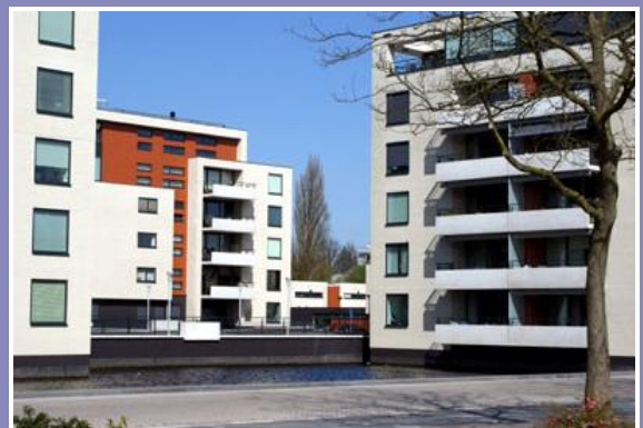
De Leede is het mooiste gebouw van Roosendaal.

In de zomermaanden mocht het publiek via de site van het gemeentearchief zijn stem uitbrengen op een van de dertig genomineerde gebouwen. De lijst was heel divers en varieerde van de Moeder Godskerk tot het kantoor van de Belastingdienst en van de geluidswalwoningen in de Weihoek tot basisschool De Kameleon. De vijf gebouwen met de meeste stemmen gingen door naar de finale, waarbij een aanbevelingscommissie de gebouwen aan het publiek voorstelde. Vervolgens koos het publiek, onder toezicht van een notaris, De Leede als het mooiste gebouw van Roosendaal. Het woningencomplex mag dus de plaquette op de gevel schroeven. Waar precies, dat blijft even de vraag, want het complex telt drie woontorens met 64 appartementen en twintig stadswoningen. Het publiek ging vooral voor de ruimtelijke setting van het complex en het feit dat de bewoners zoveel keuze wat indeling betreft hadden. Het complex dateert uit 2007 en werd ontworpen door het Roosendaalse architectenbureau Algra & Marechal.