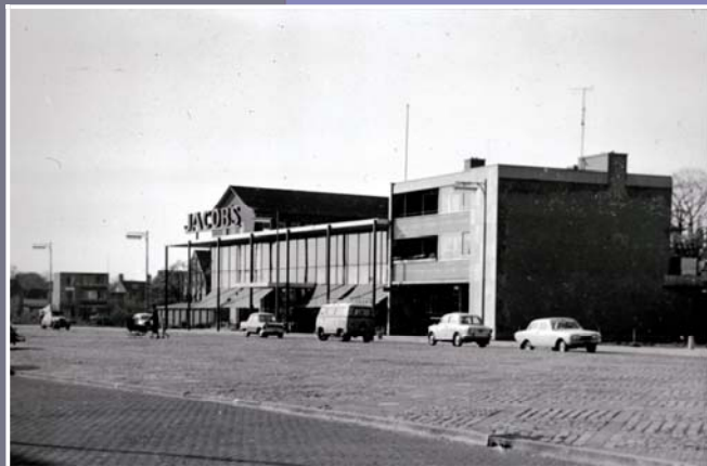
Het plein in aanbouw, Jacobs en de Boerenleenbank zijn net klaar.

Al in 1940, net voor de oorlog uitbrak, hield het gemeentebestuur zich bezig met de vraag wat er met de wei van Dekkers moest gebeuren. Het stuk weiland, uiterst centraal gelegen pal achter het stadshart, kon veel beter worden benut. De eerste plannen vonden geen doorgang, maar jaren later is het stuk weiland veranderd in een modern plein dat we kennen als de Nieuwe Markt. In het gemeentearchief is al een tentoonstelling over de Nieuwe Markt te bezichtigen, deze tentoonstelling heeft een uitbreiding gekregen in het pas opgeleverde paviljoen op de Nieuwe Markt.