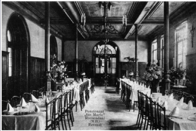
De eetzaal van het meisjespensionaat

Oud-pensionaire Mej. E. van Hasselt beschrijft haar jeugd, die ze op een meisjespensionaat doorbracht. Orde, netheid en regelmaat voerden de boventoon. Op de tentoonstelling over kostscholen, die tot eind september in het VVV-kantoor in Rosada Factory Outlet te zien is, krijgt u een beeld van het kostschoolleven van vroeger.