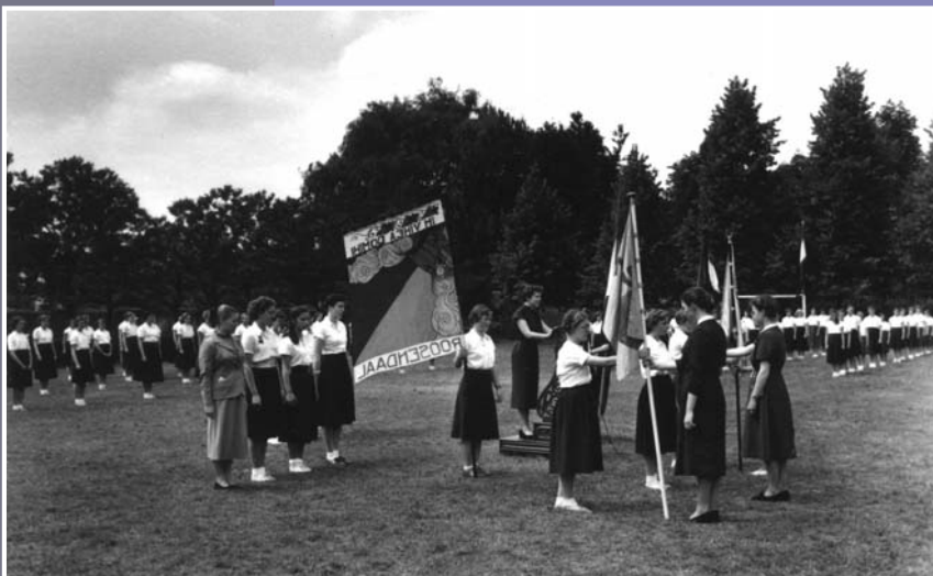
Vaandeloverdracht bij het einde van het schooljaar.

De tentoonstelling is een initiatief van het gemeentearchief en Heemkundekring De Vrijheijt van Rosendale. Op de tentoonstelling krijgt u een indruk van het leven op de kostschool van vroeger. U vindt er onder meer foto's van de kostscholen, de pensionaires, de zusters en de broeders, de studentenverenigingen en de uitstapjes. De tentoonstelling is te bezoeken in het VVV-kantoor op Rosada Factory Outlet.