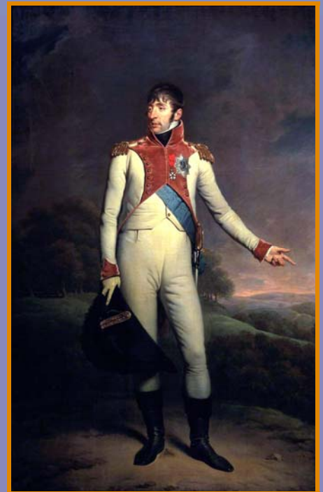
Koning Lodewijk Napoleon

De tentoonstelling kwam tot stand in samenwerking met het Gemeentearchief Roosendaal, CBK-West-Brabant, het BKC, Centrum voor de Kunsten beeldend en het provinciale initiatief Schatten van Brabant. 'Een koning kwam voorbij; Geboorte van een stad' is van zaterdag 13 juni tot zondag 27 september te zien in Museum Tongerlohuys, Molenstraat 2 te Roosendaal. Het museum is geopend van dinsdag tot en met zondag van twee tot vijf. Kijkt u voor meer informatie op www.tongerlohuys.nl of belt u naar 0165-536916.