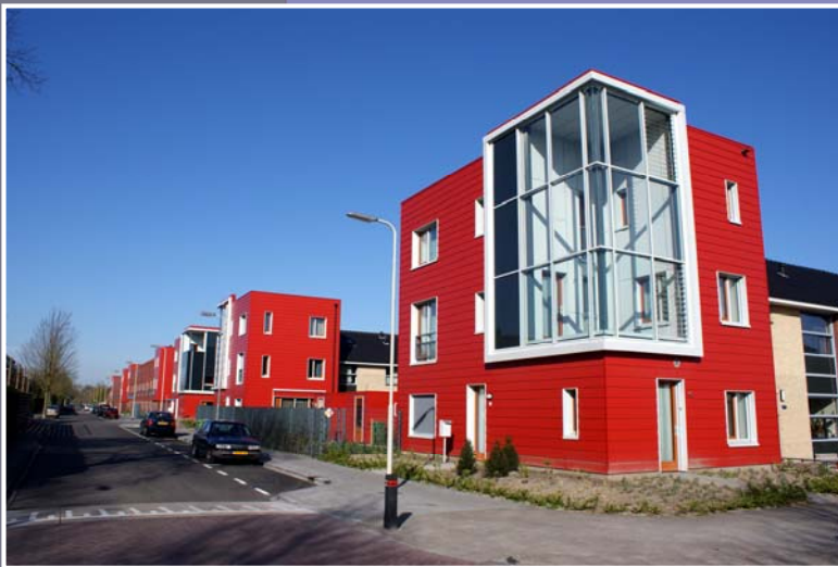
De woningen aan de Beetslaan: mooiste gebouwen van 2009?

Roosendaal telt veel gebouwen, van monumenten tot ultramoderne bouwwerken. Sommige gebouwen zijn niet meer dan glas en steen, andere hebben echt een ziel. Het gemeentearchief is op zoek naar het mooiste gebouw van Roosendaal, gebouwd na 1965. Welk gebouw spreekt u het meeste aan? Oftewel: welk gebouw heeft de X-