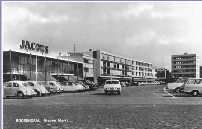
Het parkeerterrein op de Nieuwe Markt

De tentoonstelling geeft een boeiend beeld van de ontwikkeling van de Nieuwe Markt. De eerste winkels vestigden zich in de jaren vijftig op het plein. Beeldbepalend waren Jacobs meubelen en de Boerenleenbank. Aan de overkant, de zuidzijde van het plein, werden flats gebouwd. De komst van V&D, het grootste warenhuis van West-Brabant, in 1965, was ongekend voor die tijd. Drommen mensen hadden zich in de stromende regen voor de opening verzameld en zodra de deuren opengingen, stortte de mensenmassa zich op de koopjes. Van linnengoed tot supermarktartikelen tot speelgoed en diervoer, V&D verkocht het.