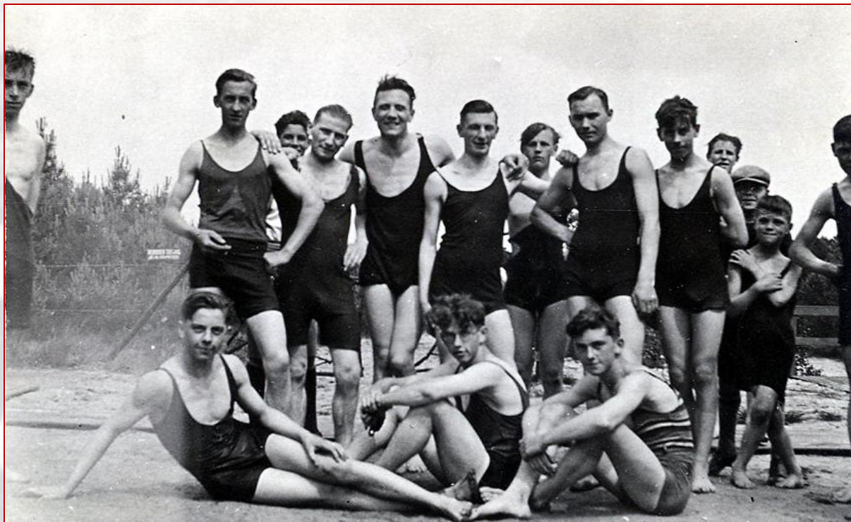
Een groep jongemannen in zwembad Zonneland, 1932.