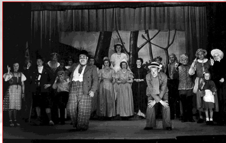
De Gouden jubileumrevue 'Wat zeg je daarvan, Koke' van Onderling Kunstgenot, 1969.

Het archief van de Toneelvereniging Onderling Kunstgenot uit Nispen, 1923-2009 (archief 491) is ontsloten en er is een plaatsingslijst beschikbaar. Het archief beslaat 0,6 vierkante meter en bevat notulen, correspondentie en de scripts van veel toneelstukken en revues. Toneelvereniging Onderling Kunstgenot Nispen is een amateur toneelvereniging die sinds 1919 actief is in het Nispense verenigingsleven. Het eerste stuk dat gespeeld werd was het drama 'De godloochenaar'. Een toneelzaal had Nispen toen nog niet; er werd gewoon in een café gespeeld.