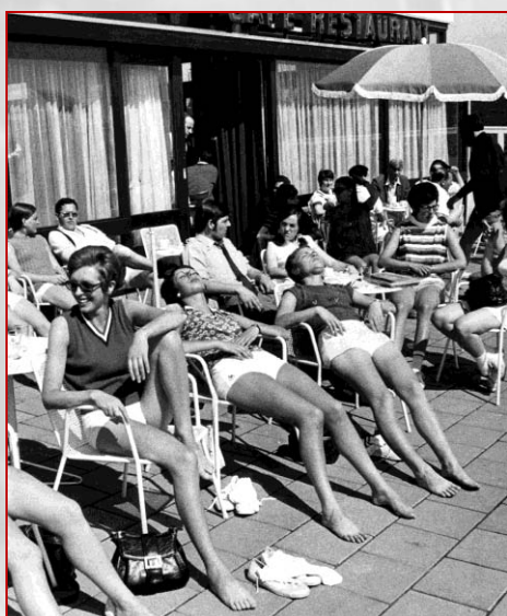
Ambtenaren rusten tijdens een sportdag uit op het terras van De Leede. Foto: De Stem/Ben Steffen, 1971