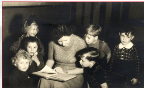
Verhalen zijn van alle tijden

Een subsidie van de Provincie Noord-Brabant maakt een snelle realisatie mogelijk. Op Roosendaal Vertelt worden verhalen aan een bepaalde locatie gekoppeld. Wil je bijvoorbeeld weten welk verhaal zich op de Markt heeft afgespeeld? Klik dan op het plattegrondje van de gemeente Roosendaal op de Markt en lees bijvoorbeeld het verhaal over de moord op Popke Driessen. Naast verhalen, kun je straks ook zelf foto's en films uploaden. De enige voorwaarde is dat het verhaal (of gedicht, foto of film) met Roosendaal (of de kerkdorpen) te maken heeft.