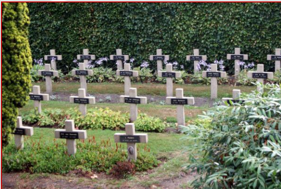
De graven van oorlogsslachtoffers op de begraafplaats aan de Bredaseweg.

Aan het eind van de ochtend cirkelden twaalf tot zestien Amerikaanse bommenwerpers op grote hoogte boven de stad. Op zich niets bijzonders, niemand schonk er aandacht aan. Om 11.22 uur lieten de 'vliegende forten' echter 35 ton bommen vallen op de Bloemenmarkt, Dominéstraat, Ludwigstraat, Emile van Loonpark, Oranjeplein, Stationsstraat, Turfberg (gasfabriek) en Havendijk (kandijfabriek Van Gilse en zuivelfabriek Het Anker).