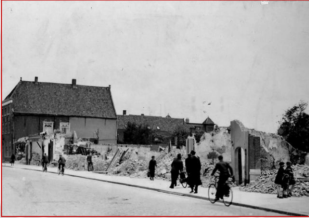
De zwaar getroffen Molenstraat na het bombardement van 11 mei 1940. Foto: B. Luijsterburg, 1940

Om ongeveer 20.00 uur voerden vliegtuigen van de Duitse Luchtwaffe een verschrikkelijk luchtbombardement uit boven de Roosendaalse binnenstad. Hierbij kwamen twintig mensen om het leven en werden tachtig huizen in onder andere de Molenstraat, de Damstraat, Emmastraat, Burgerhousstraat en Sint Josephstraat door brand vernield.